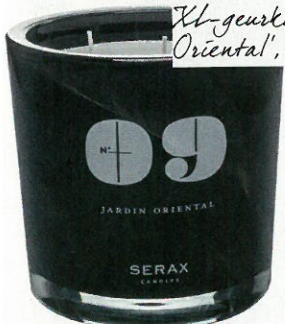
Xl-geurkaars 'Jardin Oriental', bij Serax, 76,89 €