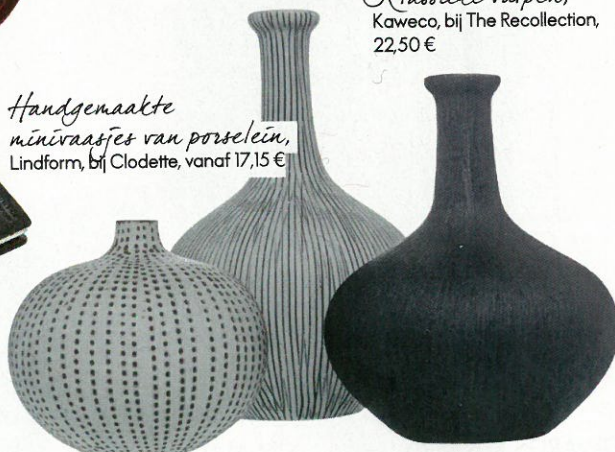
Handgemaakte mini-vaaftjes van porselein, Lindform, bij Clodette, vanaf 17,15 €