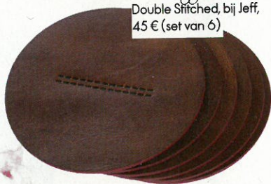
Handgemaakte leren onderleggers, Double Stitched, bij Jeff, 45 € (set van 6)