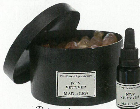
Potpourri 2.0., Mad et Len, bij The Recollection, 85 €