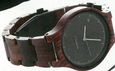
Ecologisch en handgemaakt houten horloge, Kerbholz, bij Supergoods, 129 €