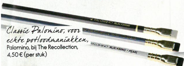
Classie Palomino, voor echte potloodmaniakken, Palomino, bij The Recollection, 4,50 € (per stuk)