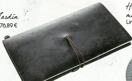
Leren cover om maximaal 12 notaboekjes in op te bergen, Midori, bij Stad Leest, 44,90 €