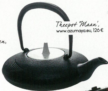
Theepot 'Maan', www.azumaya.eu, 126 €