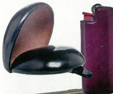
Italiaanse degelijkheid: geldbeugel en leren aanstekerhoesje, Il Bussetto, bij Studio Helder, 58 en 24 €